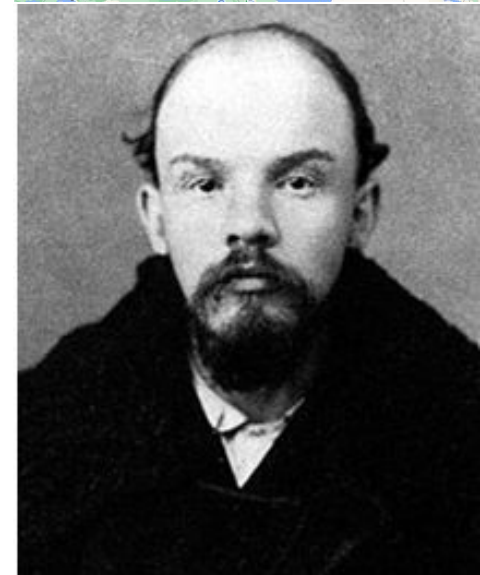
Vladímir Ilich Uliánov alias Lenin (1870-1924)