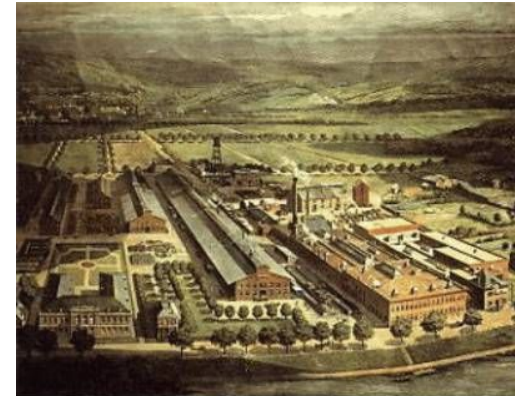
Industria de colorantes Albany Aniline & Chemical Company ca. 1870.