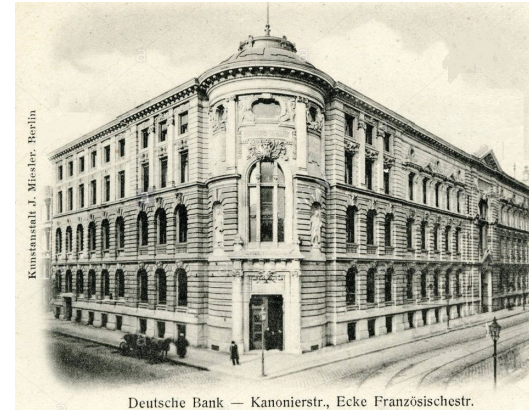
Deutsche Bank, Berlín, Alemania. A ppios del s. XX.