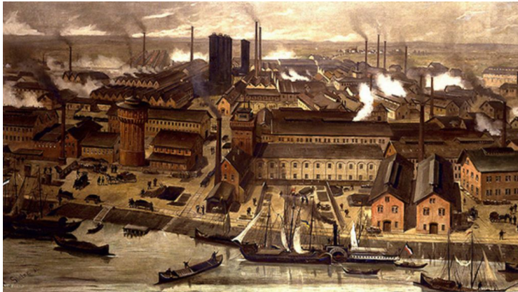
Factoría química BASF en Ludwigshafen, Alemania, 1881.

“El director “X” controla la sociedad matriz. Esta, a su vez, ejerce el dominio sobre las sociedades que dependen de ella (“hijas”), las cuales controlan a otras sociedades (“nietas”), etc. De esta manera con pequeños capitales pueden controlarse cantidades inmensas de producción: si poseer el 50% del capital es suficiente para controlar una sociedad anónima, al director “X” le basta con poseer solamente un millón para controlar 8 millones de capital en las sociedades del tercer nivel (nietas):