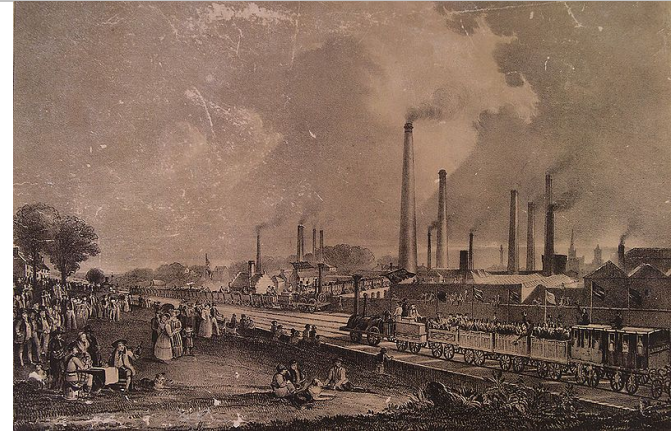
St. Rollox Chemical Works en la inauguración del ff.cc Garnkirk y Glasgow en 1831 (D.O. Hill)